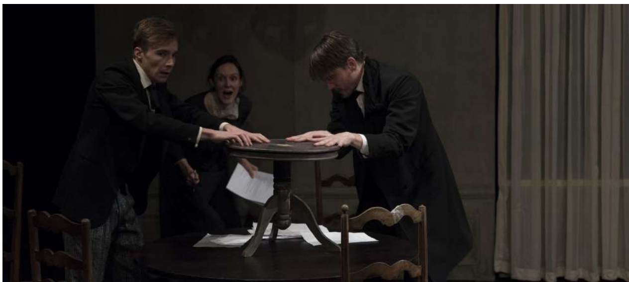
Théâtre Berthelot © Hervé Bellamy

Représentation 2017 Représentations au Théâtre Berthelot, Montreuil, décembre 2017 / 2 représentations