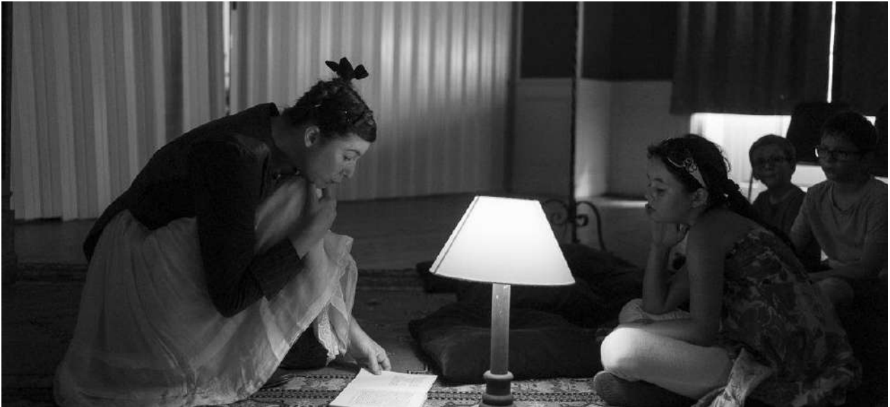
Les Foulées, Chaumussay 2017

Représentation 2017 Représentations au Doc, Paris, février 2017 / 2 représentations