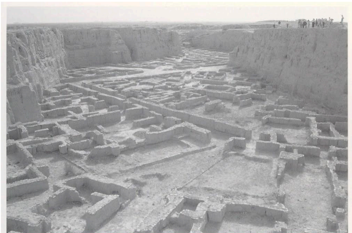
Fouilles de Suse, chantier Ghirshman : ville royale, niveau XIV.

Pour la saison 2023/2024, une forme courte sur la figure de Jane Dieulafoy, Journal de fouilles , sera créée au sein de plusieurs établissements scolaires d'Ile-de-France (collèges ou lycées). Les élèves pourront participer au processus d'élaboration (répétitions, construction de la scénographie, des costumes et des accessoires) tout au long de l'année, et ce, jusqu'à la création du spectacle, qui sera présenté dans les salles de classes. Le travail autour de cette forme courte s'accompagnera d'ateliers à partir des textes, dessins et photographies de Jane Dieulafoy, en lien avec des archéologues, un graphiste-illustrateur (Gaspard Njock) et une scénographe (Clémence Kazémi). Les élèves auront également un parcours de spectateur.rice avec des sorties, au musée du Louvre où ils.elles verront la frise du Palais de Darius au département des Antiquités orientales (visite commentée et dessinée des salles Dieulafoy), aux archives de l'Institut national de l'histoire de l'art , ainsi que dans des théâtres d'Ile-de-France.